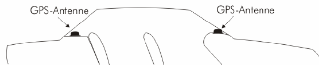
Bild 1: Einbauplätze für die GPS-Innenantenne

Für einen optimalen Sichtwinkel der Antenne ist diese auf dem Armaturenbrett vorn unter der Windschutzscheibe zu befestigen. Die Installation auf der Hutablage ist ebenfalls möglich (Bild 1). Dabei wird die Antenne waagrecht ausgerichtet. Die Antenne darf nicht direkt neben einer bereits vorhandenen GPS-Antenne installiert werden (Antennen können sich gegenseitig beeinflussen). Wenn ein geeigneter Installationsort gefunden ist, sollte der GPS-Empfang überprüft werden (siehe Kontrolle des GPS-Empfangs), bevor die Antenne und das Antennenkabel endgültig montiert und verlegt werden.